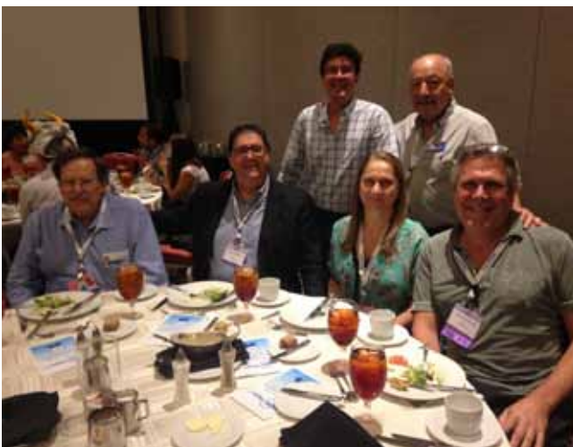
La Delegación de Brasil durante el almuerzo de premiación.