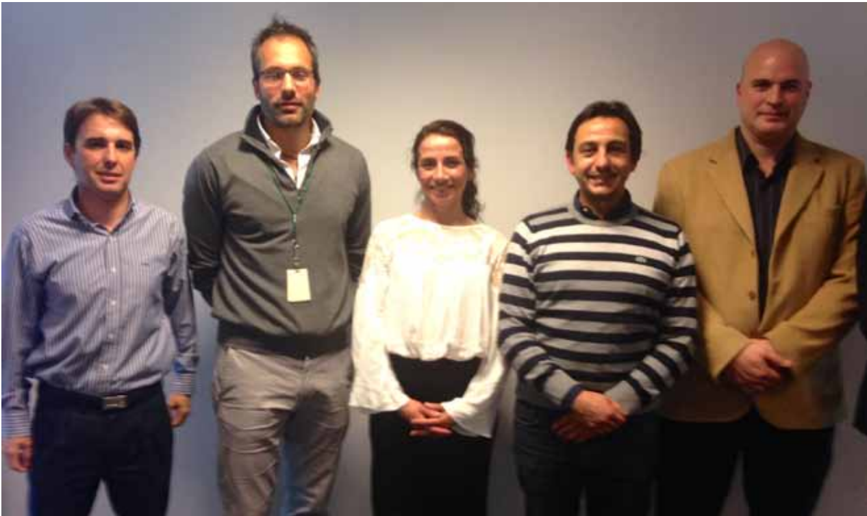
Nuevo Board of Governors 2016-2018